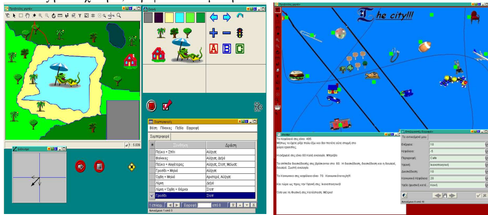
Εικόνα 2. «Περιήγηση στο πάρκο» (αριστερά) «Περιπέτειες στην πόλη» (δεξιά)

πάρκο» (βλ. εικ.2). Στο μικρόκοσμο αυτό ο μαθητής έχει τη δυνατότητα να ορίσει και να περιγράψει τη συμπεριφορά μίας κινούμενης οντότητας συνθέτοντας με την χρήση εικονικών συμβόλων εκφράσεις του τύπου συνθήκη – δράση: π.χ. αν βρεθείς στη λίμνη τότε αύξησε ταχύτητα, στρίψε και σταμάτησε.